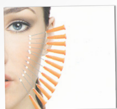
RESULTADOS ENTRE 18 A 24 MS